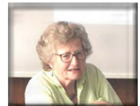
Myra Marx Ferree, Mai 2016

This talk focused on the paradoxes produced when measures enhancing gender equality is combined with academic capitalist policy agendas. These paradoxes are not just American, but play out in distinctive ways across all globalizing institutions of higher education especially as they increase managerial control over faculty and focus on national competitiveness. The talk compared doomsayers like Nancy Fraser who take a Cassandra-like posi