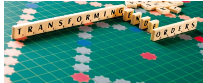
Cecilia Scheid/Cornelia Goethe Centrum 2012

Zum anderen prägen inter- bzw. transnationale Perspektiven aktuelle Debatten und wissenschaftliche Projekte der Geschlechterforschung. Im Zentrum stehen dabei unter anderem Re-Visionen hegemonialer (westlicher) Paradigmen und Erzählungen. Es geht darum, vom Rande her zu denken, bisher ausgeschlossene Sichtweisen einzubeziehen und von dort aus Fakten und Daten neu zu bewerten und andere Zusammenhänge herzustellen.